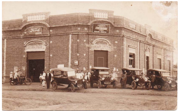
VENTA DE AUTOMÓVILES Y TALLER DE MERLINO Y BONETTO EN LA ESQUINA DE CÓRDOBA Y AV. BELGRANO (AÑO 1922)