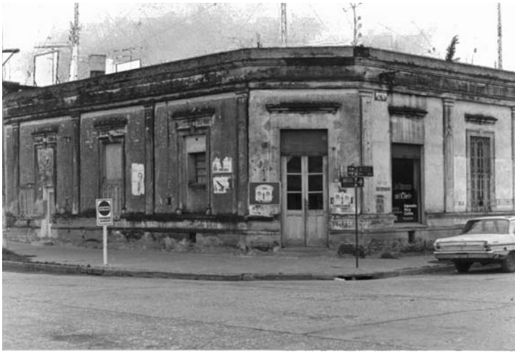
LA CANTINA DEL CHOLO EN LA ESQUINA DE MONTEVIDEO Y AVDA. ITALIA (DÉCADA DE 1970)