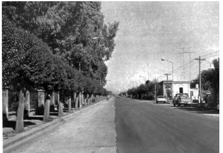
ASPECTO DE AVDA. ITALIA EN LA DÉCADA DE 1970 CUANDO AÚN SUBSISTÍAN LAS PLANTAS DE NARANJAS AMARGAS