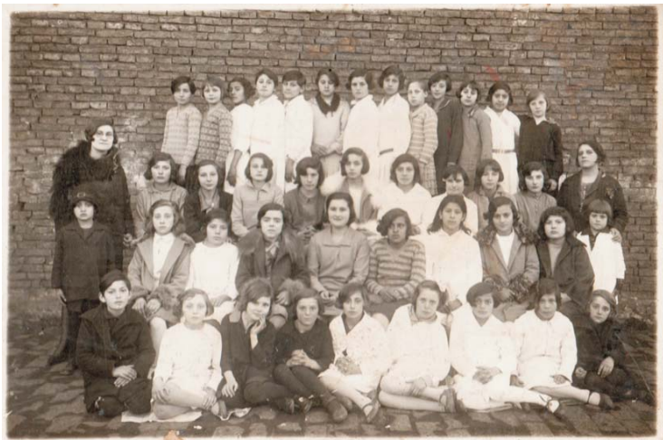
DOCENTES Y ALUMNOS DE LA ESCUELA FISCAL (HIPÓLITO YRIGOYEN) EN EL AÑO 1928