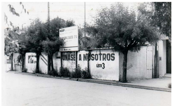
PROPAGANDA POLÍTICA DONDE LUEGO SE CONSTRUIRÁ EL EDIFICIO DE CORREOS (CALLE CÓRDOBA/ DÉCADA DE 1980)