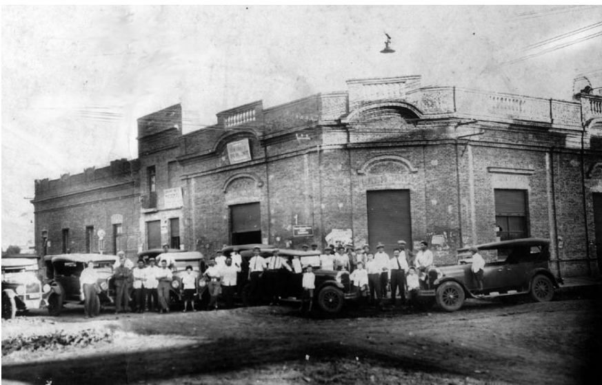
EDIFICIO EN LA ESQUINA DE CÓRDOBA Y SAN MARTÍN, DONDE HOY FUNCIONA CASA BOLATTI