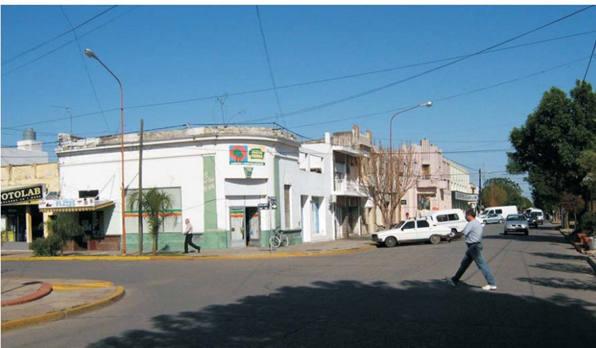
ESQUINA DE CÓRDOBA Y 25 DE MAYO EN LA DÉCADA DE 1990