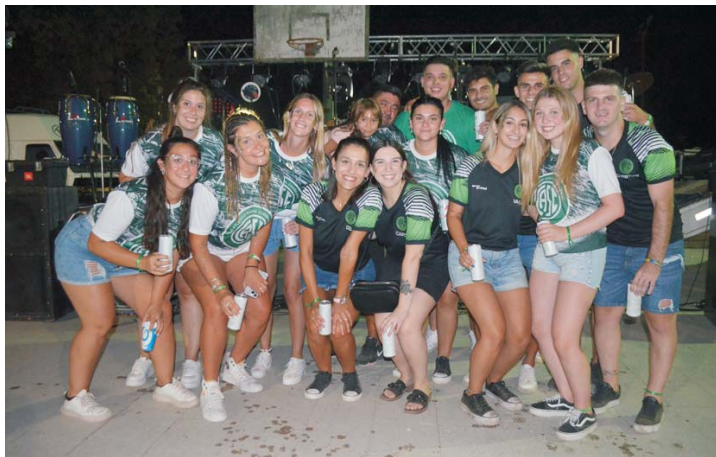
LOS INTEGRANTES DE LA COMISIÓN JUVENIL