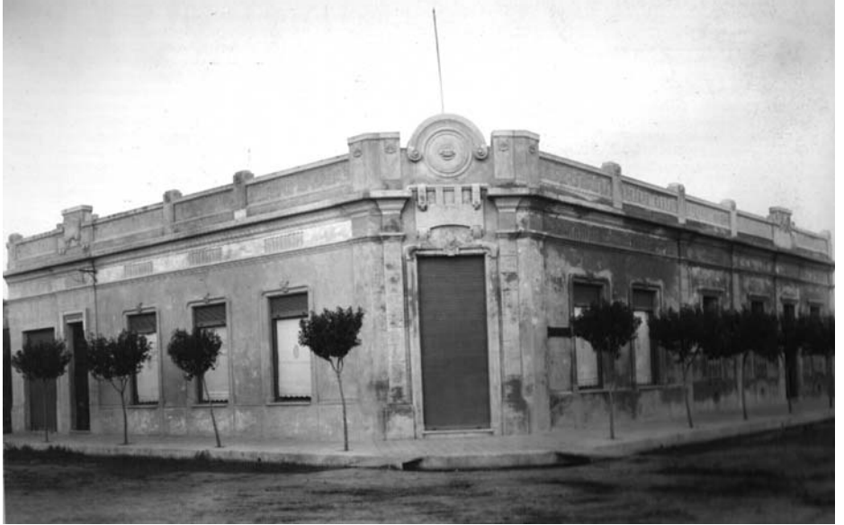
CUATRO IMÁGENES QUE REGISTRAN LA CONSTRUCCIÓN DE LA PRIMERA SUCURSAL DEL BANCO PROVINCIA DE CÓRDOBA EN LA ESQUINA DE CÓRDOBA Y 25 DE MAYO INAUGURADO EL 11/12/1929. EN 1957 SE TRASLADARÍA AL ACTUAL EDIFICIO.